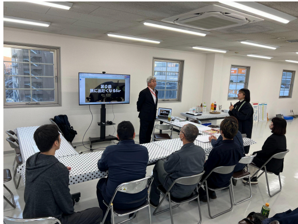
※旅に出たくなるBarの第0回の様子