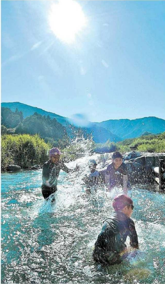
川遊びをして厳しい暑さをしのぐ子どもたち ＝28日午後4時ごろ、島田市川根町