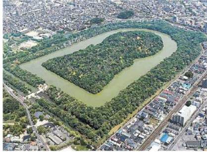
百舌鳥・古市古墳群の大山古墳一堺市