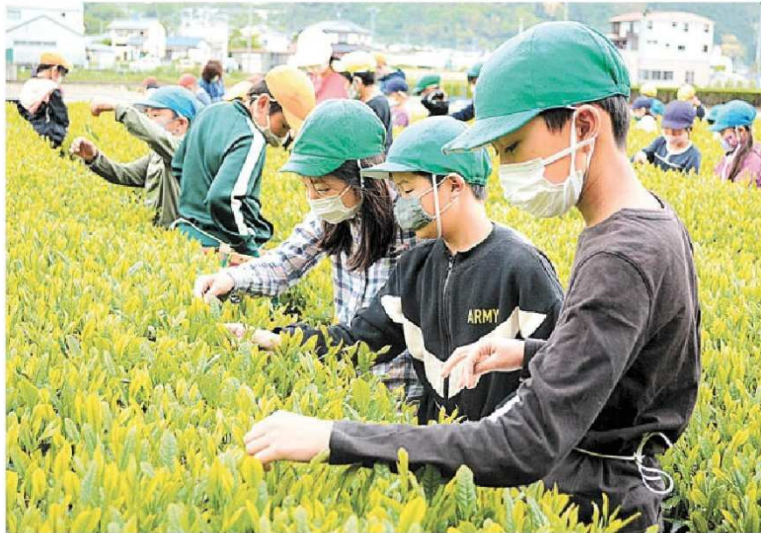
真剣な表情で茶を摘み取る児童ら＝静岡市葵区