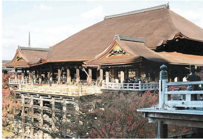
本堂の檜皮屋根のふき替えと床板の張り替え工事が完了した清水寺の本堂。3日午前、京都市

京都市東山区の世界遺産・清水寺で、国宝・本堂の檜皮(ひわだ)屋根のふき替えと「清水の舞台」の床板の張り替え工事が完了し、3日に奉告法要が行われた。信徒総代や工事関係者らが参列し、森清範貫主は法要後「創建当初の姿によみがえり感無量です」と話した。 2017年に本堂を