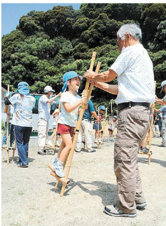
地域ボランティアとの交流を楽しみながら竹馬に挑戦する園児＝掛川市立さかがわ幼稚園

④記事の見出しの「口」には、竹馬に乗る園児のようすを入れたいと思います。あなたなら、どんな言葉を入れますか。10字以内で書きましょう。