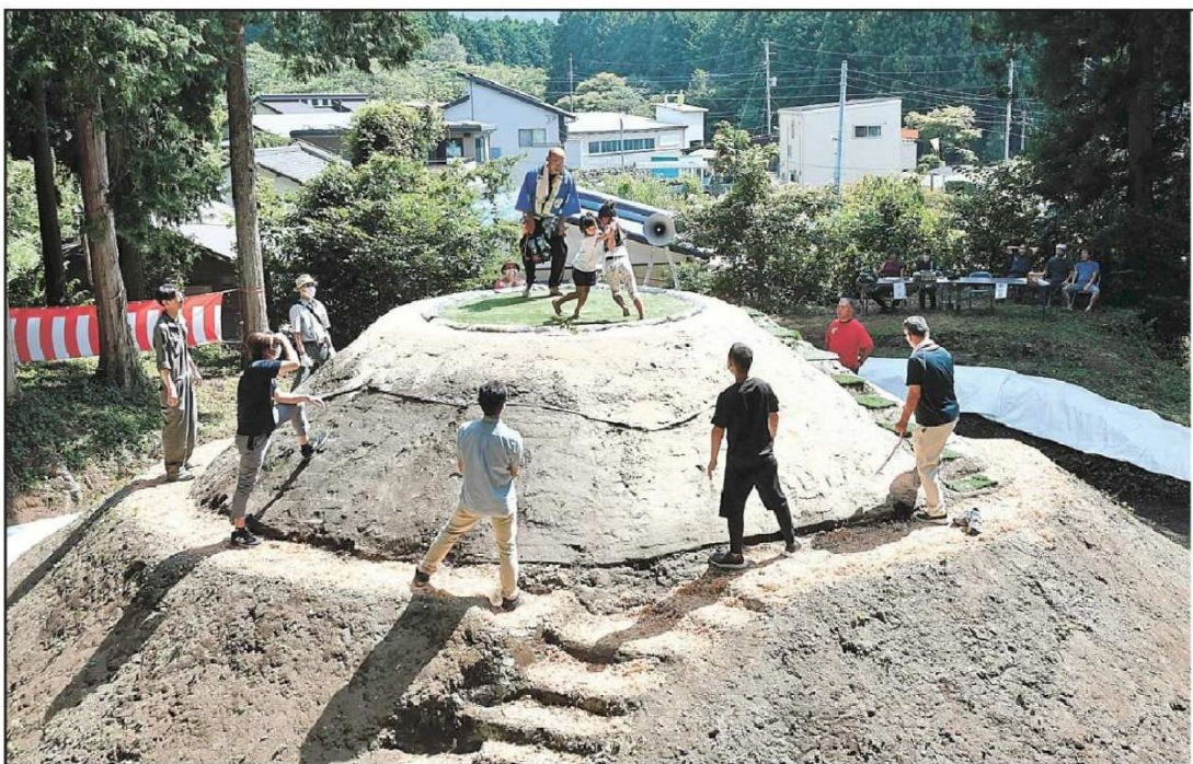
日本一高いと称される土俵で相撲を取る子どもたち＝富士宮市の上井出天満宮