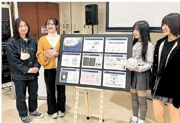
考案した企画について説明する学生たち 静岡市葵区の静岡デザイン専門学校

静岡デザイン専門学校グラフィックデザイン科の2年生が26日、日本平動物園（静岡市駿河区）の活性化に向けて考案した企画を同市葵区の同校で発表した。同園の関係者が耳を傾けた。