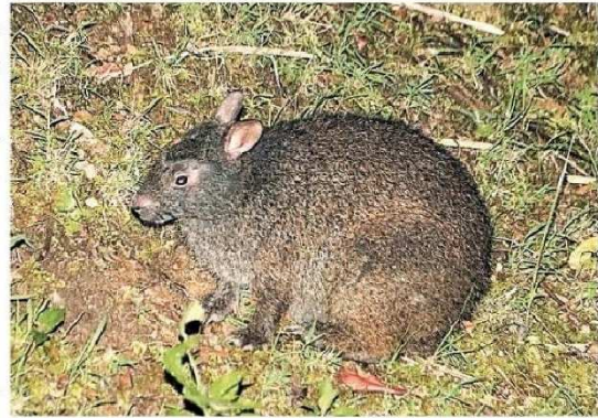
アマミノクロウサギ 11月3日、鹿児島県・奄美大島

鹿児島県の奄美大島や徳之島に生息する国の特別天然記念物、アマミノクロウサギが車にはねられる被害が増えつつある。両島などは月内にも世界自然遺産に登録される見込みで、国際自然保護連合（IUCN）は貴重な野生動物の事故増加を懸念。環境省は8日までに奄美市で開いた検討会で、動物の道路への進入を防ぐフェンスの設置などを提言した。 アマミノクロウサギは小さい耳に短い脚が特徴。近年、外来種マングースの駆除が進んだことなどで生息エリアが広がる一方、車にひかれる被害も増加傾向にある。昨年は奄美大島で過去最多の50件、徳之島でも2番目に多い16件が発生した。 沖縄大の山田文雄客員教授（68）は「世界に誇る奄美の宝を守るため、道路管理者などの関係機関が連携して対