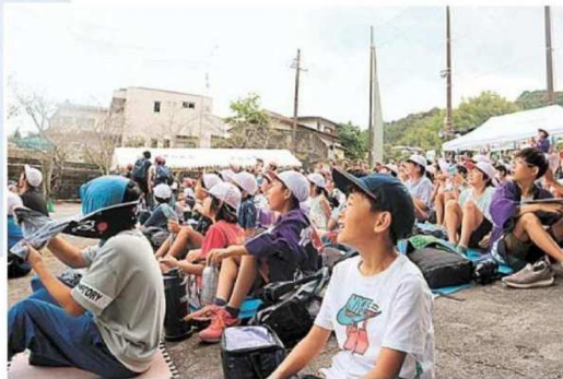
▲打ち上げられた龍勢花火＝静岡市清水区の草薙スポーツ広場周辺

り、打ち上げ前の呼び出しを務めたりして伝統技術に親しんだ。児童らは「これからも続いてほしい」「伝統をつないでいく一人になりたい」などと話し、保存会のメンバーらの思いを受け継いだ。