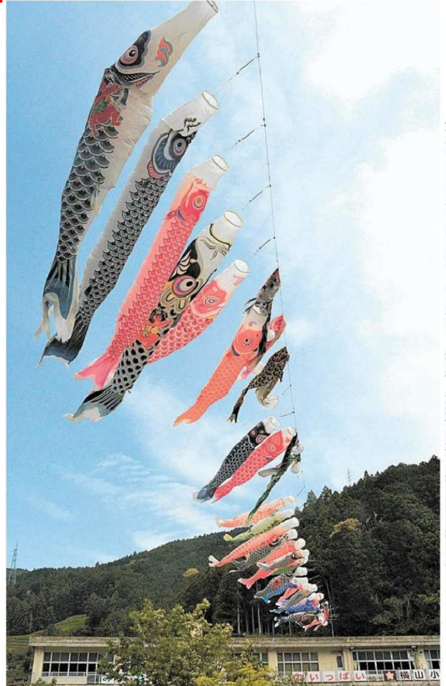
大小さまざまなこいのぼりがたなびく校庭 浜松市天竜区横山町の横山小