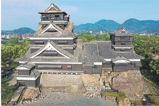
熊本地震で石垣が崩れ、屋根瓦が落ちるなど大きな被害を受けた2016年5月1日(上)と、修復が完了した今年4月25日の熊本城天守閣