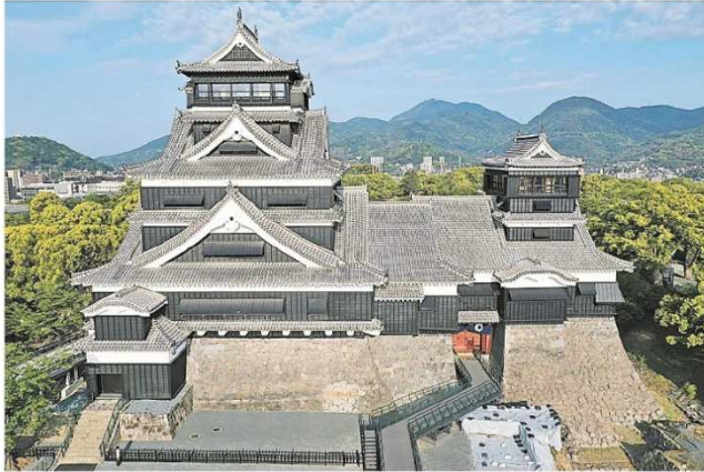
熊本市(小型無人機から)